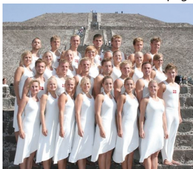
De berömda gymnasterna i Verdenshold på turné i Mexico

Utvecklingen av detta effektiva kosttillskott baseras på resultat från mer än 350 vetenskapliga