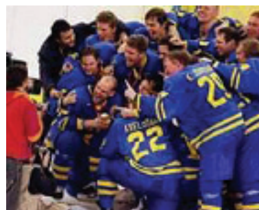
Sveriges Ishockeylandslag, OS-guld, 2006